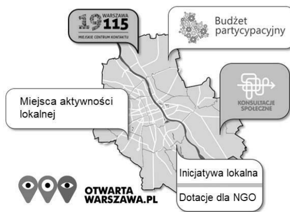
Rys. 1. Główne instrumenty partycypacji obywatelskiej w praktyce innowacyjnego zarządzania m. st. Warszawy

Cel artykułu. Celem opracowania jest identyfikacja instrumentów partycypacji obywatelskiej, zastosowane w praktyce innowacyjnego zarządzania m. st. Warszawy. Metodami badawczymi, którymi posłużono się w opracowaniu, są analiza poznawczo-krytyczna źródeł wtórnych.